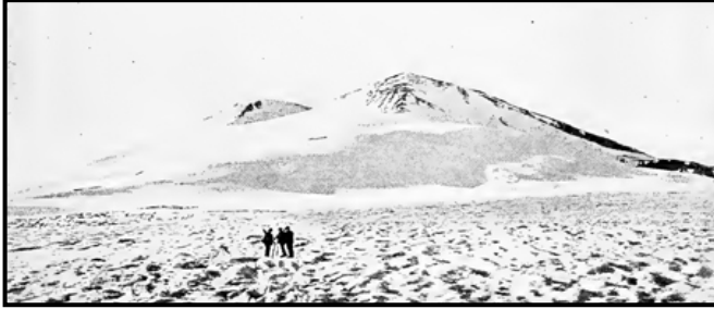
Elbruz Dağının "Büyük Platosu", [Freshfield, 1902; 161] 13

Dünya resmî dağcılık kayıtlarına göre Elbruz ve Kazbek zirvelerine ilk ayak basan dağcılardan olan İngiliz dağcı Douglas W. Freshfield [Erkan 1999: 73], 1868 yılındaki tırmanışlarını anlatan ve dağcılık konusunda teknik bilgilere, oldukça detaylı resimlere sahip olan iki eser hazırlamıştır. Karaçay ve Malkarlar hakkında ve yaşadıkları coğrafya dair çok ayrıntılı –özellikle Elbruz dağı hakkında– bilgiler sunmakla beraber bu halkların etnik kökenleri hakkında çok fazla bilgi vermemektedir. Freshfield, Çerek vadisinde bulunan ve yaklaşık 13.000 kişiden oluşan bu topluluğun kendilerini "Dağ Türkleri" olarak tanımladıklarını ve eski bir Türk diyalektiği ile konuştuğunu belirtmiştir [Freshfield 1902: 60].